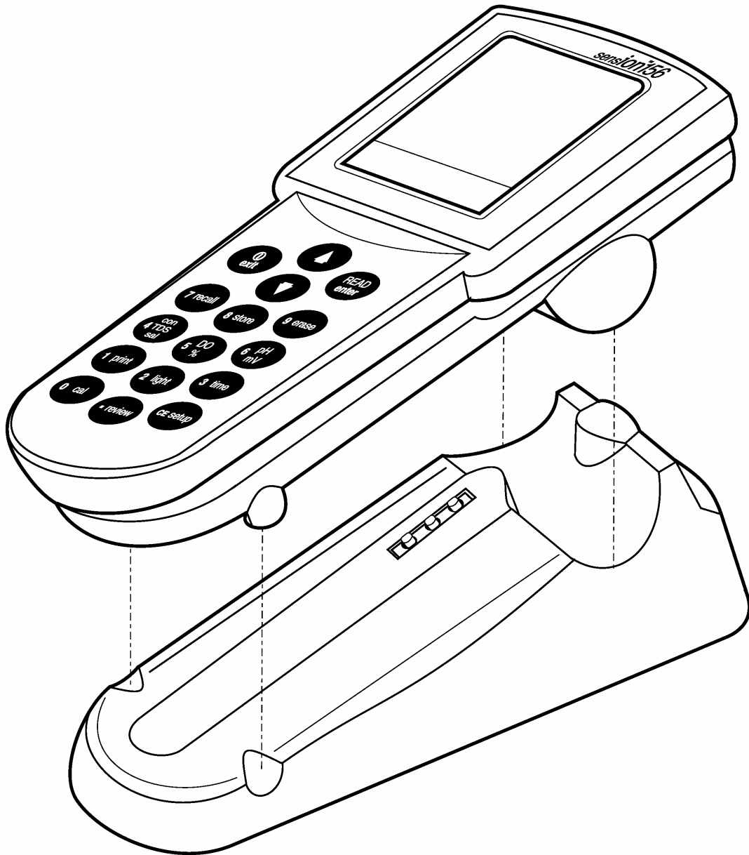
图 3 使用 sension 电源座