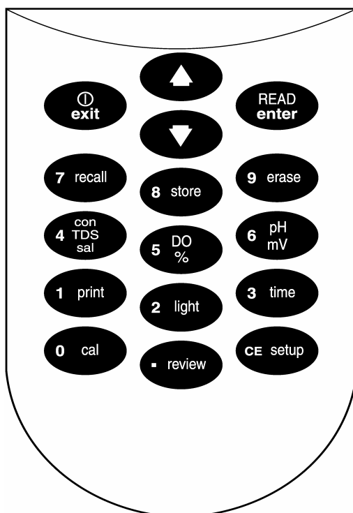
图 1 sension156 键盘